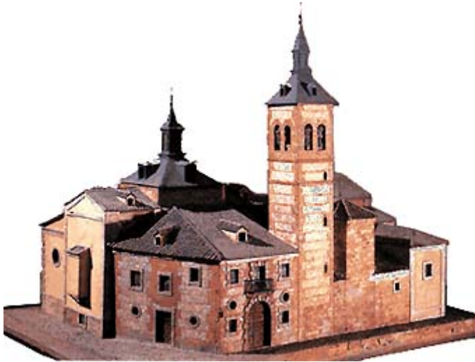
Maqueta de la iglesia de Santa María, por J. Monasterio.

determinadas zonas o edificios de la villa y la edición del plano llegase a mediar un periodo de tiempo tan largo como el mencionado de dieciocho años. No se puede saber con certeza, desde luego, si esta iglesia de Santa María fue uno de esos primeros edificios dibujados, pero esa es la única explicación que puedo encontrar a tal hecho”.