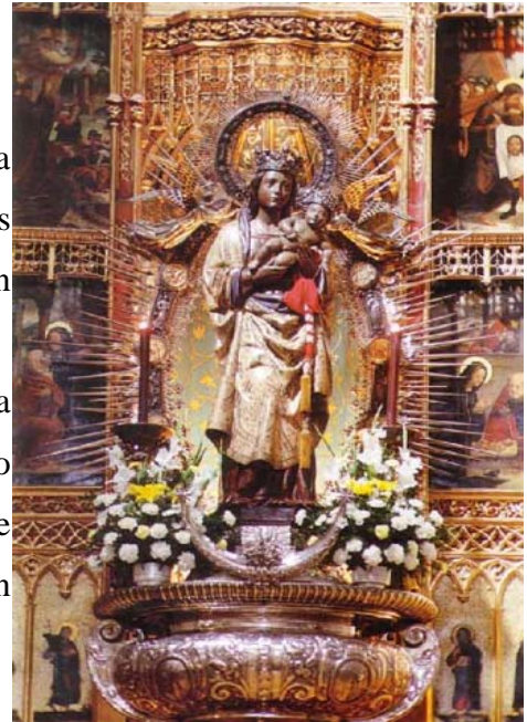
Virgen de la Almudena

El Niño presenta en su mano a la Virgen la medalla de brillantes que le concedió el Ayuntamiento de Madrid en 1946, siendo ésta la primera que se concede, ya que la Virgen de la Almudena es también Patrona del Ayuntamiento.