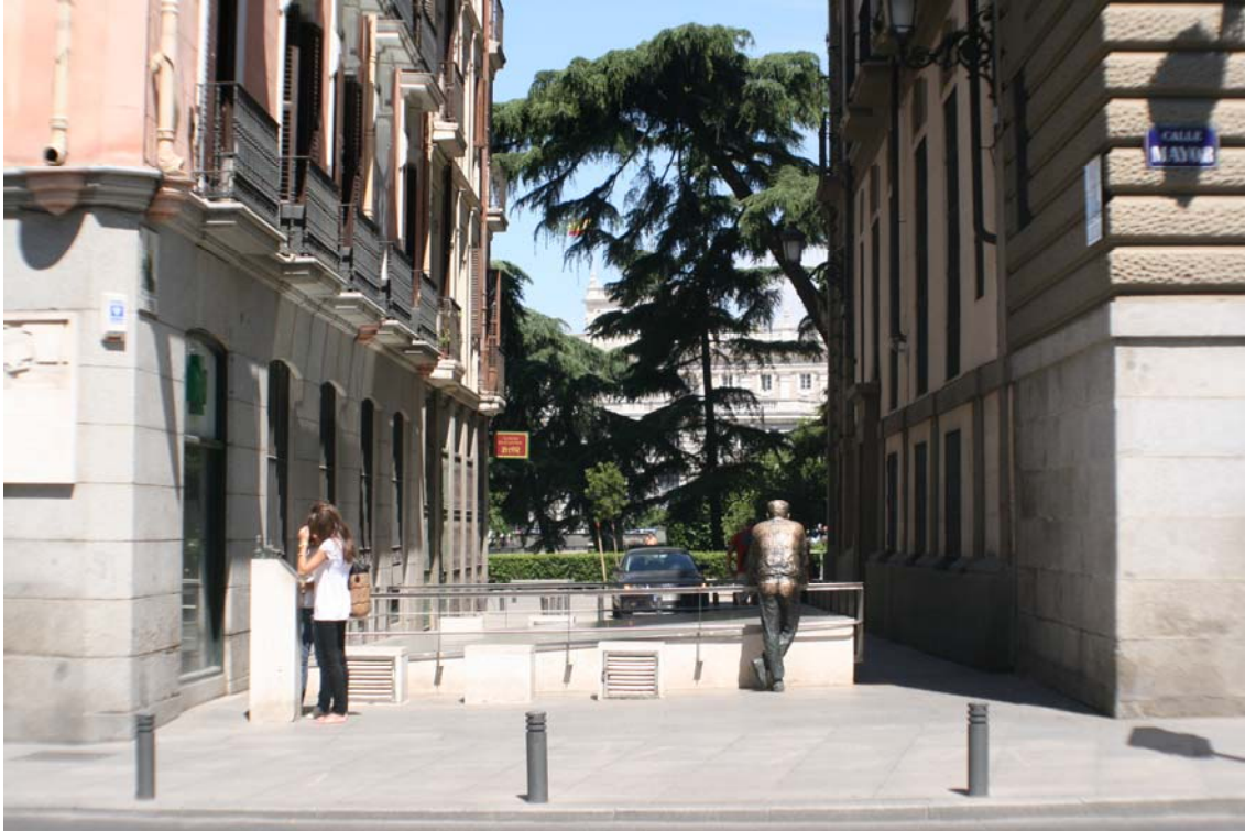
Lugar de situación de los restos visibles de la Iglesia de Santa María.